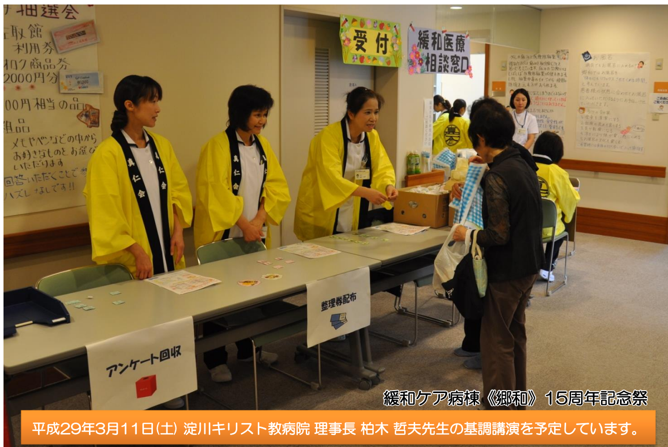
緩和ケア病棟《郷和》15周年記念祭

私達は地域に育てられた。 患者様は家族であり、隣人であることを忘れまい。 各病院の機能を最大限に生かした質の高い医療と誠意を 尽くして住民の信頼に応え、地域への責任を果たそう。