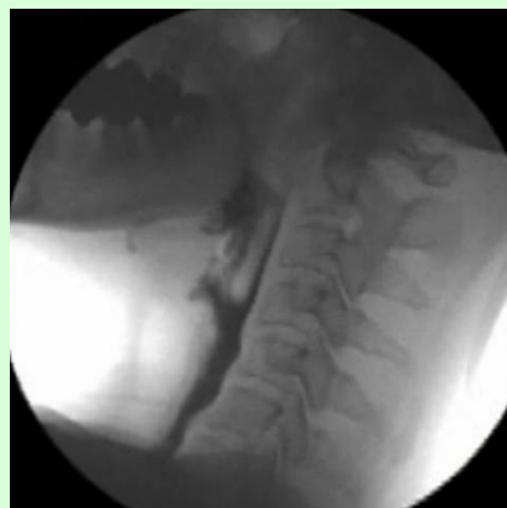
図2 VF側面像 造影剤の流れと器官の 構造がよくわかる