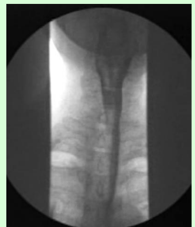
図3 VF正面像 咽頭通過の左右差、 食道通過を評価できる