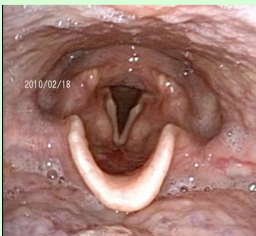
図1 VEで見た咽喉頭（のど）の構造

摂食嚥下障害の患者様に、少しでもおいしい食事を安全に楽しく食べていただくために、これらの検査を役立てていきたいと思っています。どうぞご理解とご協力をお願いいたします。