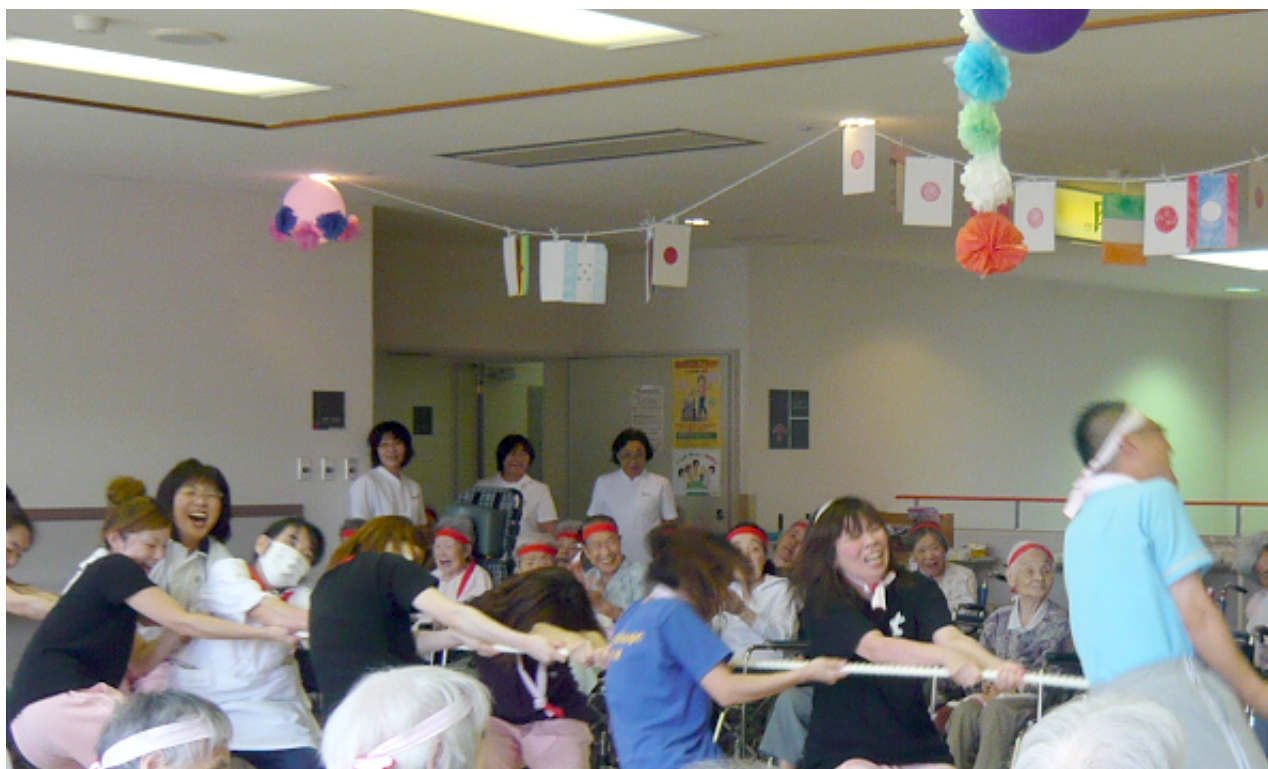
愛宕の里：運動会の様子

患者様は家族であり、隣人であることを忘れまい。 各病院の機能を最大限に生かした質の高い医療と誠意を 尽くして住民の信頼に応え、地域への責任を果たそう。