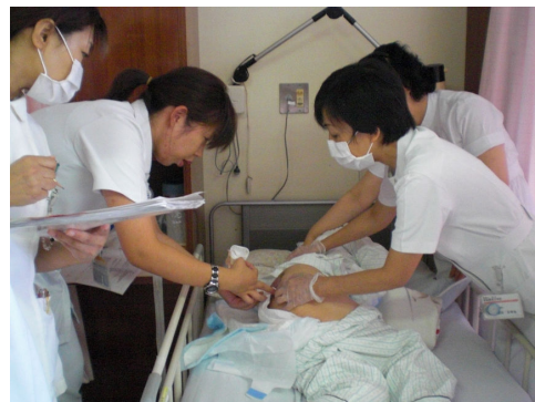
褥瘡回診（南部郷厚生病院にて）

体圧分散マットレス・エアーマットなどを使用して、体の一定の場所に圧がかかるのを防ぐ、自分で寝返りができない場合は、代わりに体の向きを変えてあげる、皮膚を健康な状態に保つ、栄養状態を良くするなどがあります。