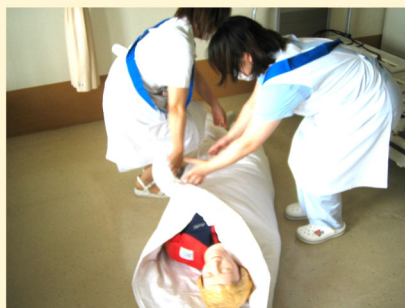
想定患者に人形を使用し担架で搬送

7月6日、東4階病棟一般浴室からの出火を想定し、避難訓練を実施しました。患者役の人形を担架搬送し、護送患者、歩行患者などそれぞれすばやく救護することができました。