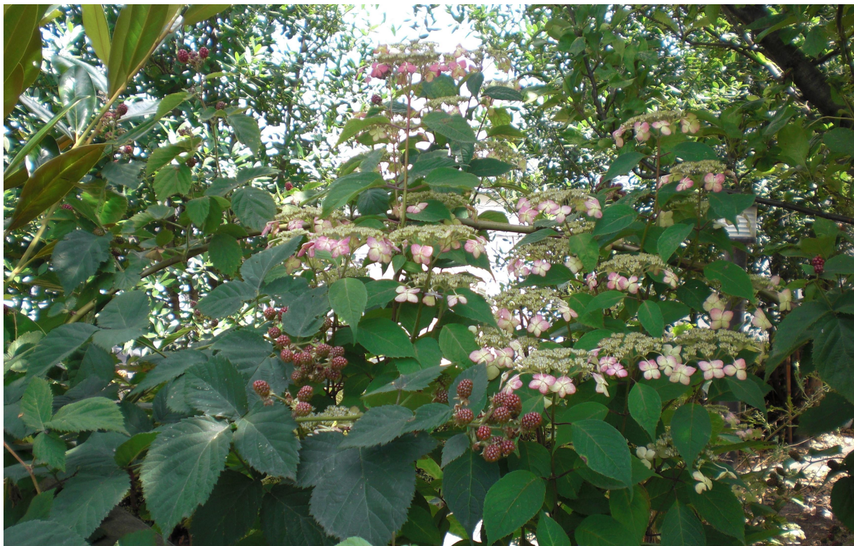
南部郷厚生病院 薬草園：ブラックベリー&甘茶

患者様は家族であり、隣人であることを忘れまい。 各病院の機能を最大限に生かした質の高い医療と誠意を 尽くして住民の信頼に応え、地域への責任を果たそう。