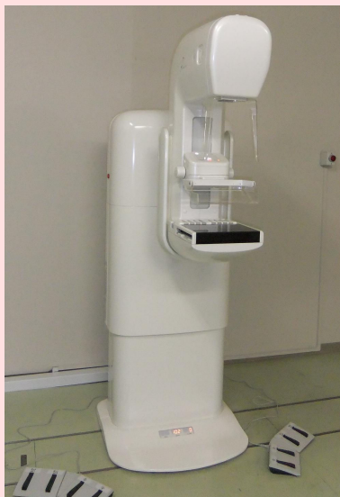
東芝メディカルシステムズ株式会社製 乳房X線撮影装置 Pe・ru・ru (ペ・ル・ル)