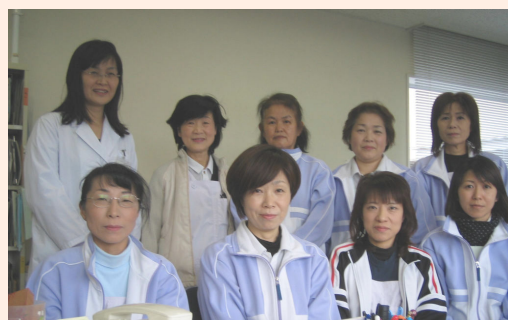
訪問看護ステーション スタッフ