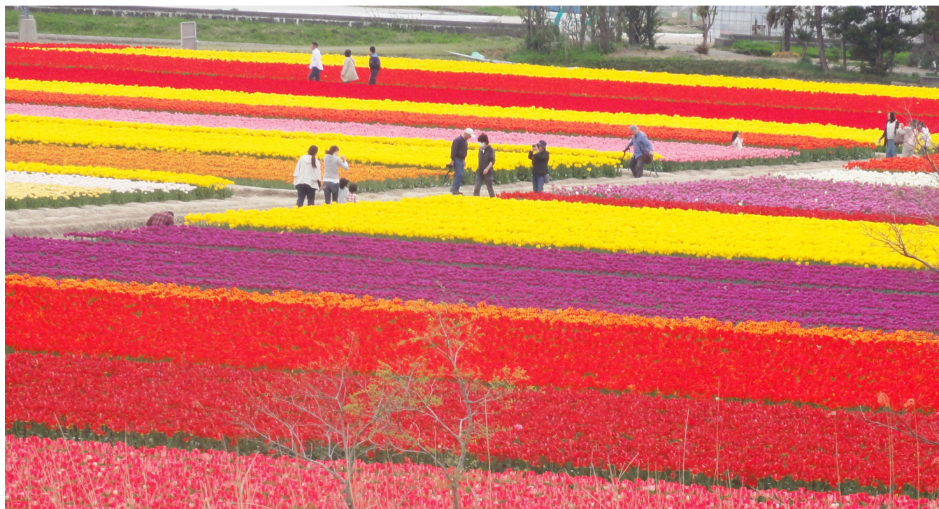
2012年 五泉市 チューリップ畑

私達は地域に育てられた。 患者様は家族であり、隣人であることを忘れまい。 各病院の機能を最大限に生かした質の高い医療と誠意を 尽くして住民の信頼に応え、地域への責任を果たそう。