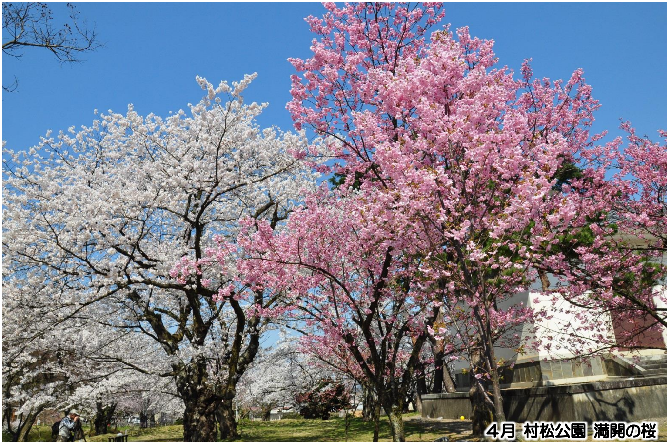
4月 村松公園 満開の桜

私達は地域に育てられた。 患者様は家族であり、隣人であることを忘れまい。 各病院の機能を最大限に生かした質の高い医療と誠意を 尽くして住民の信頼に応え、地域への責任を果たそう。