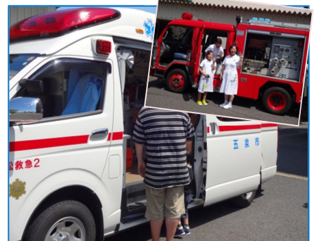
救急車・消防車乗車体験