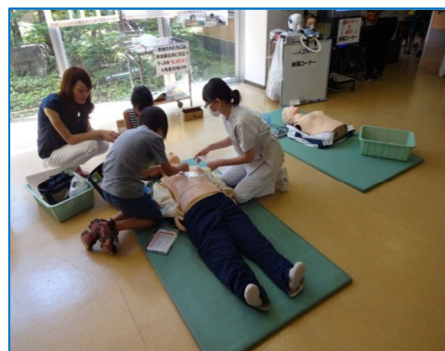
AED・心臓マッサージ体験