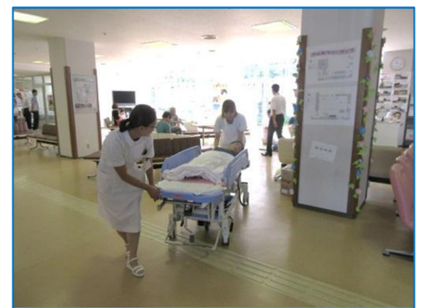
ストレッチャー体験