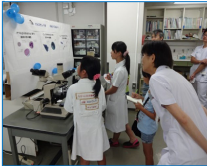
検査室 がん細胞や細菌が見えたよ