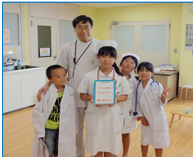
看護師ドクター白衣着用