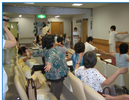
「北国の春♪」に合わせ呼吸体操