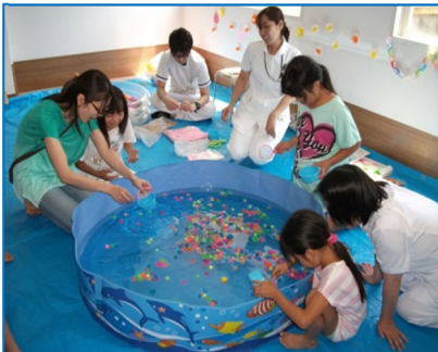
スーパーボールすくい、水風船など