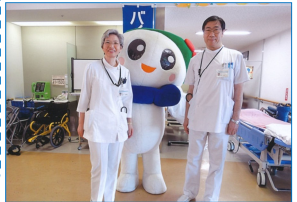
五泉市のマスコットキャラクター