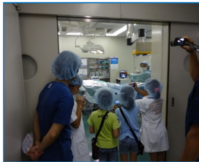
手術室 清潔な環境です