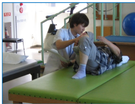
腰痛リハビリ体験