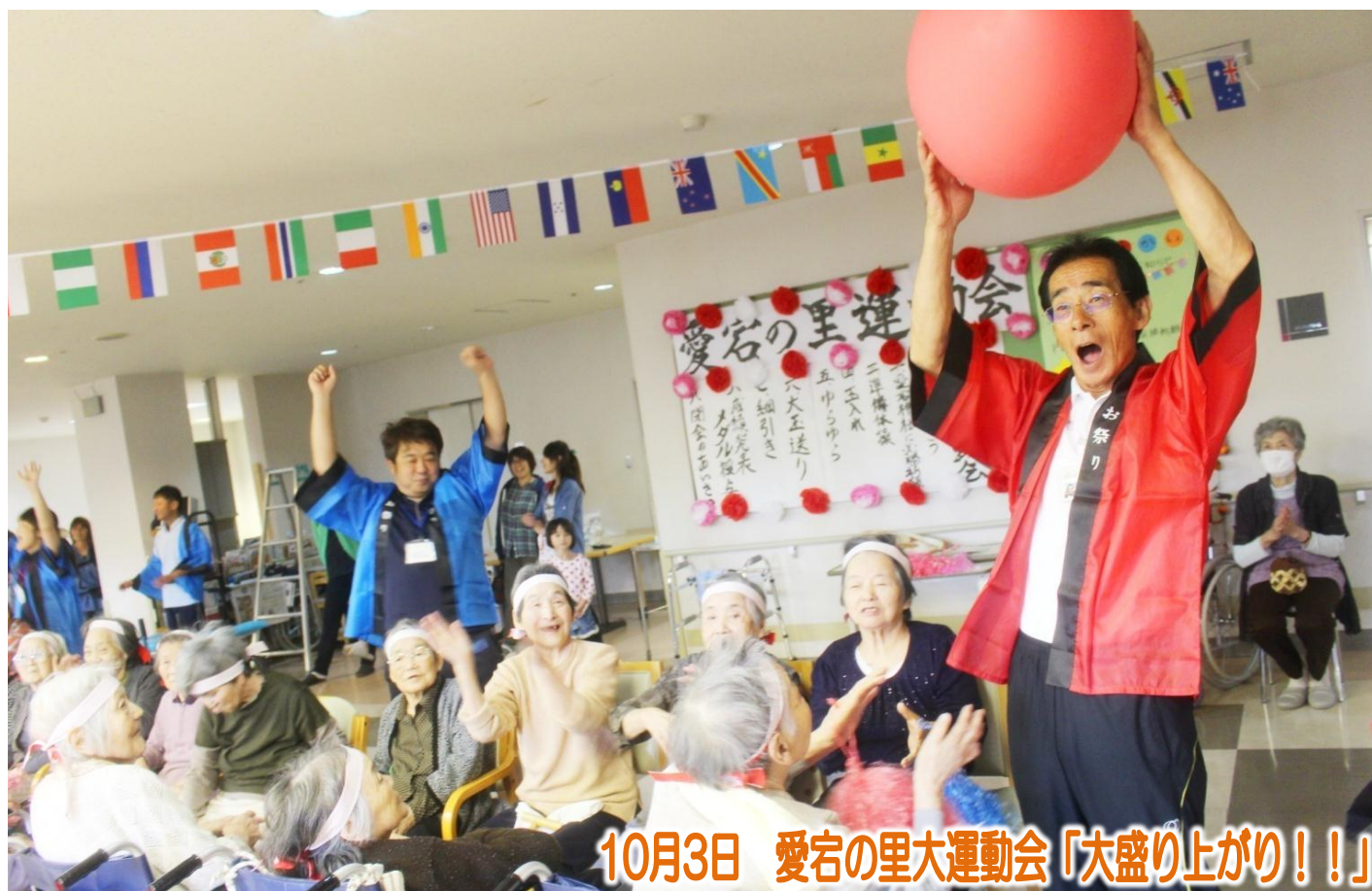
10月3日 愛宕の里大運動会「大盛り上がり!!!」

私達は地域に育てられた。 患者様は家族であり、隣人であることを忘れまい。 各病院の機能を最大限に生かした質の高い医療と誠意を 尽くして住民の信頼に応え、地域への責任を果たそう。