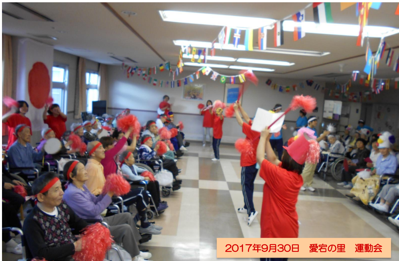
2017年9月30日 愛宕の里 運動会

私達は地域に育てられた。 患者様は家族であり、隣人であることを忘れまい。 各病院の機能を最大限に生かした質の高い医療と誠意を 尽くして住民の信頼に応え、地域への責任を果たそう。