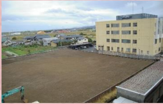
(2017/10/20撮影) 建物の取り壊しが終了した新棟建設予定地

新病院建設事業は、(株)たかだ様から取得した土地の建物の取壊しが完了し11月から仮駐車場工事に着手しました。新病院のグランドオープンは2020年(平32年)1月の予定です。