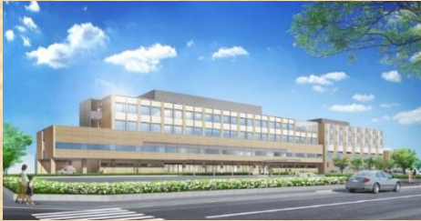
新病院完成予定図