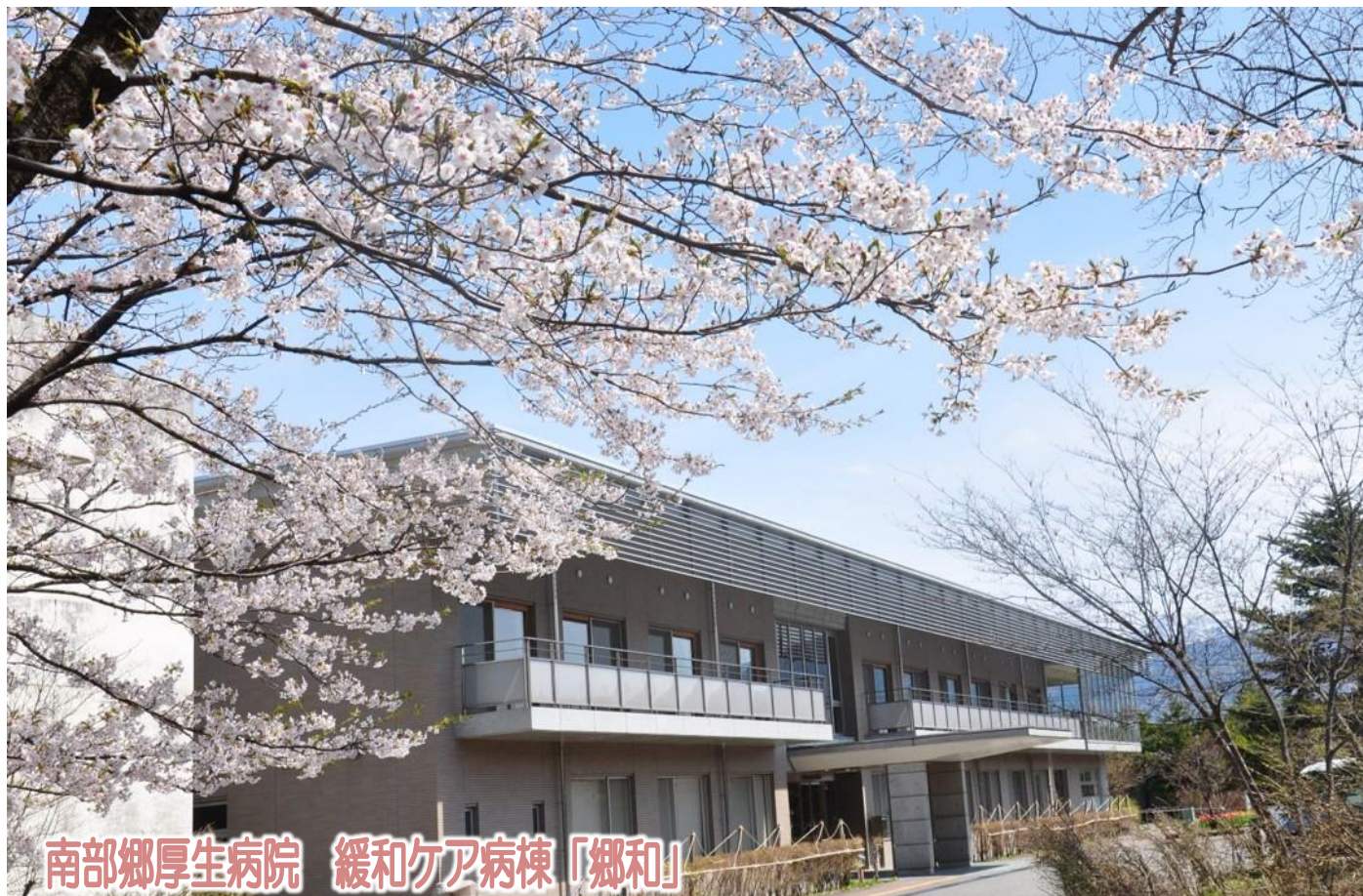
南部郷厚生病院 緩和ケア病棟「郷和」

私達は地域に育てられた。 患者様は家族であり、隣人であることを忘れまい。 各病院の機能を最大限に生かした質の高い医療と誠意を 尽くして住民の信頼に応え、地域への責任を果たそう。