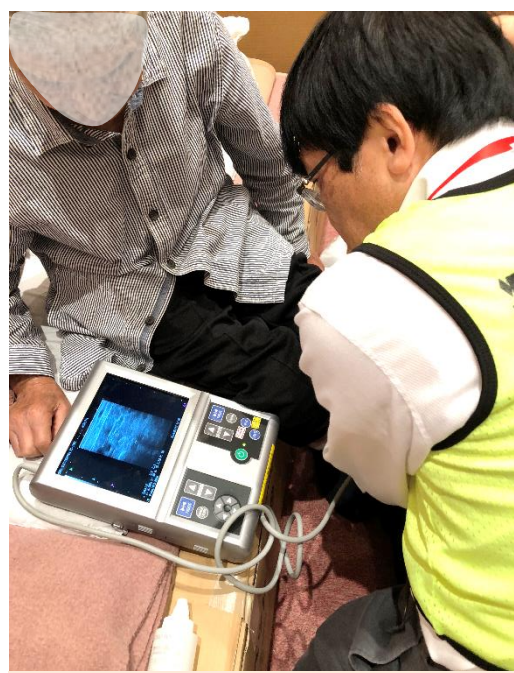
被災地にて小型超音波検査機器で 下肢静脈血栓の検査をする筆者

の早期発見と治療、心房細動による脳塞栓症を含めた血栓塞栓症、CATなどの予防が可能になると思います。そこで五泉・阿賀野・阿賀地域の動脈硬化性疾患の早期発見と塞栓性疾患の予防に貢献できればと考えていますのでよろしくお願いいたします。