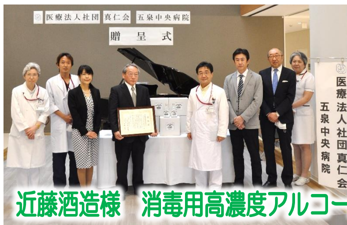
近藤酒造様 消毒用高濃度アルコール寄贈に対する感謝状贈呈式

私達は地域に育てられた。 患者様は家族であり、隣人であることを忘れまい。 各病院の機能を最大限に生かした質の高い医療と誠意を 尽くして住民の信頼に応え、地域への責任を果たそう。