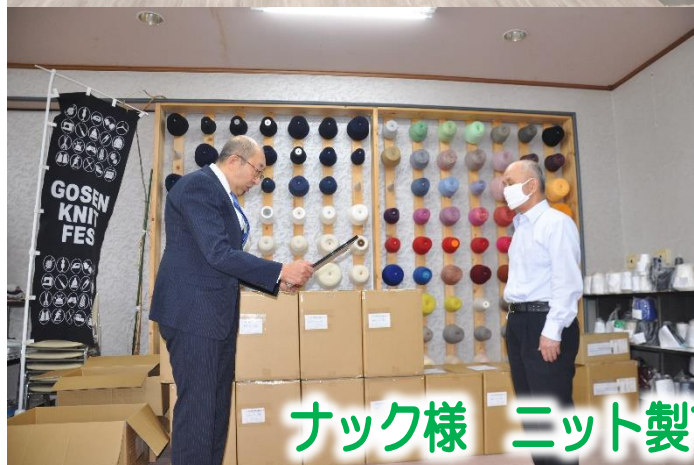
ナック様 ニット製マスク提供に対する感謝状贈呈式