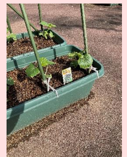
苗を植える準備万端のプランター キュウリの苗を植えました