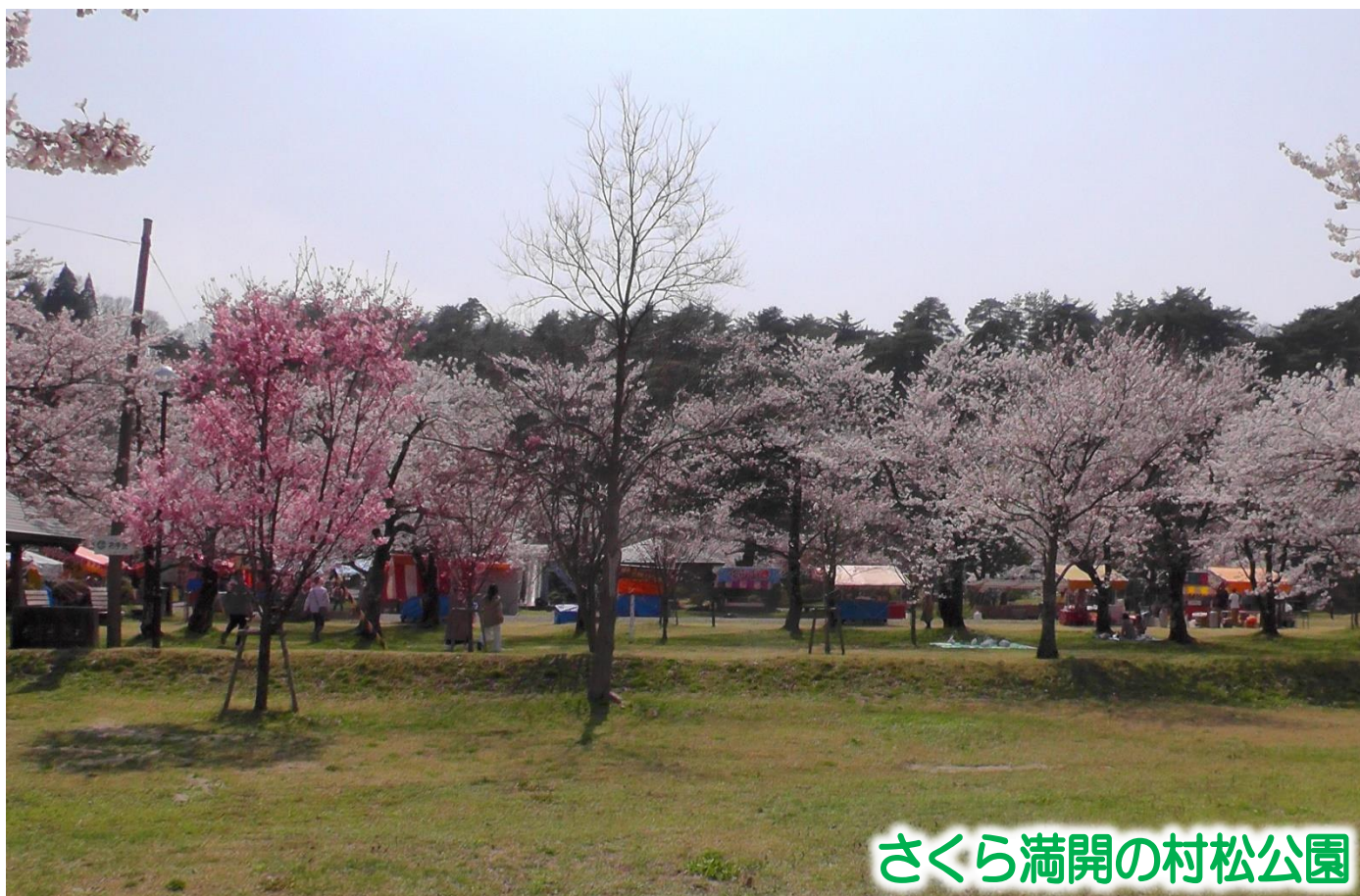
さくら満開の村松公園

私達は地域に育てられた。 患者様は家族であり、隣人であることを忘れまい。 各病院の機能を最大限に生かした質の高い医療と誠意を 尽くして住民の信頼に応え、地域への責任を果たそう。