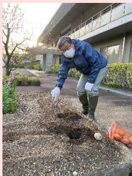
ジャガイモを植えている篠川施設長