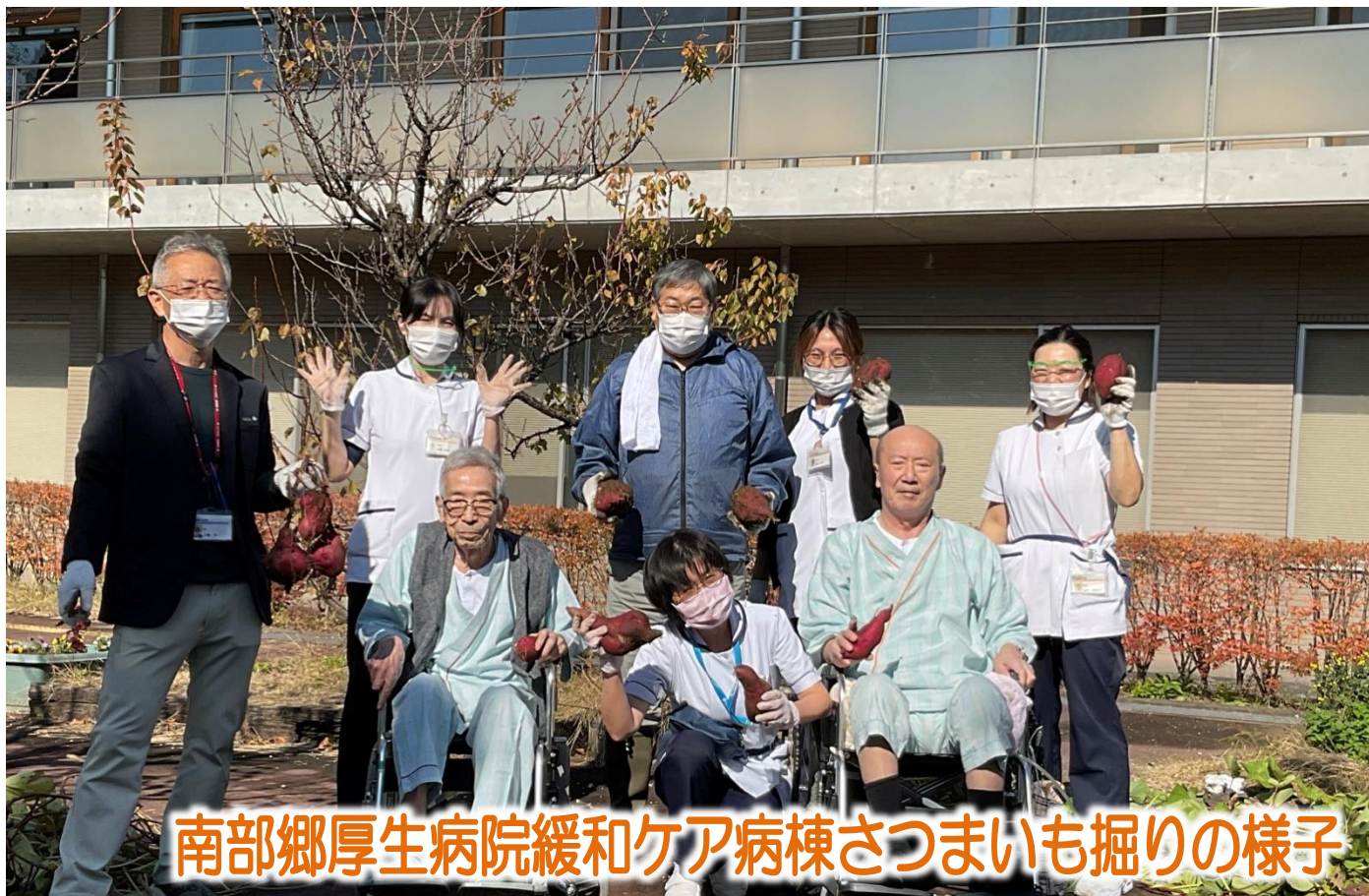
南部郷厚生病院緩和ケア病棟さつまいも掘りの様子

私達は地域に育てられた。 患者様は家族であり、隣人であることを忘れまい。 各病院の機能を最大限に生かした質の高い医療と誠意を 尽くして住民の信頼に応え、地域への責任を果たそう。