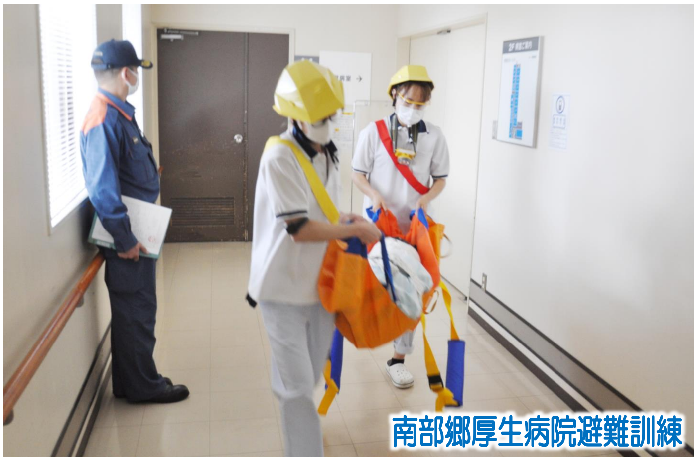
南部郷厚生病院避難訓練

私達は地域に育てられた。 患者様は家族であり、隣人であることを忘れまい。 各病院の機能を最大限に生かした質の高い医療と誠意を 尽くして住民の信頼に応え、地域への責任を果たそう。