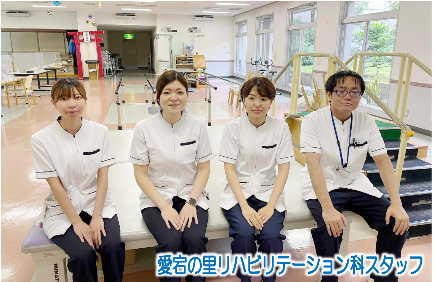
愛宕の里リハビリテーション科スタッフ

私達は地域に育てられた。 患者様は家族であり、隣人であることを忘れまい。 各病院の機能を最大限に生かした質の高い医療と誠意を 尽くして住民の信頼に応え、地域への責任を果たそう。